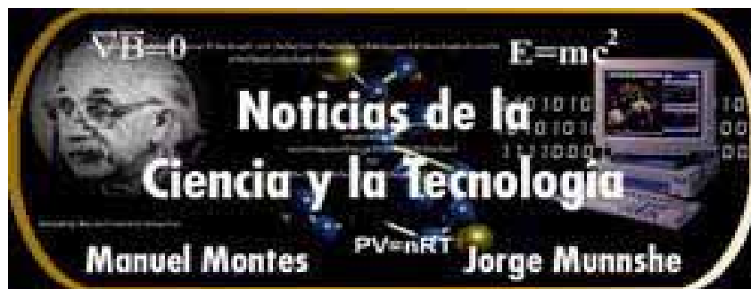
Selección de noticias para los QQ: HH., cuyo contenido permite hallarse al día con los últimos descubrimientos de la ciencia y la tecnología

Componentes electrónicos más resistentes: Como si fuesen alquimistas modernos, los actuales científicos de los materiales convierten a menudo modestas substancias en otras más deseables. Ahora, un nuevo logro en este campo acaba de producirse. Dos nuevos y extraños compuestos podrían hacer a los componentes electrónicos del futuro más pequeños, más rápidos, y más duraderos.